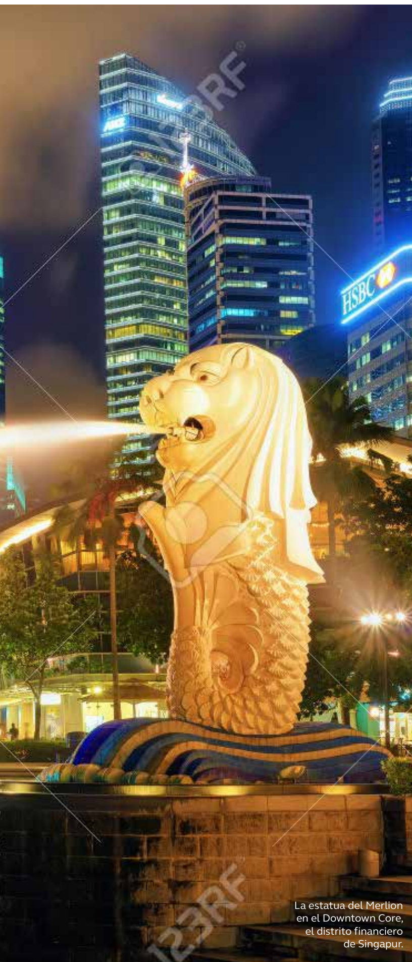
La estatua del Merlion en el Downtown Core, el distrito financiero de Singapur.